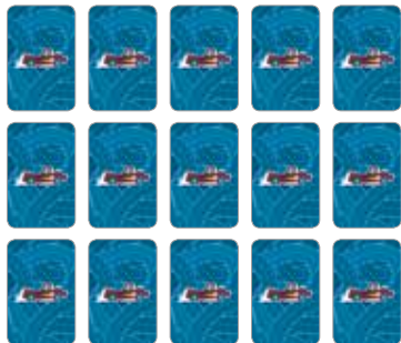
Obrázok 1: Počiatočné nastavenie

Karty sú umiestnené na stole smerom nadol v niekoľkých radoch ako pri bežnom pexese. Hráči sa striedajú. Cieľom hry je zhromaždiť, čo najviac kariet. Najmladší hráč začína hru.