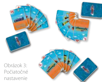
Obrázok 3: Počiatočné nastavenie

Odstráňte všetky karty bez čísel (napr. Sanitky). Zvyšné karty sa rozdelia medzi všetkých hráčov rovnakým počtom a otočia smerom nadol. Každý hráč si vezme svoje karty a položí si ich pred seba na kopy. Aby ste zaistili rovnaký počet kariet pre každého hráča, môžete vyradiť posledných pár kariet. Hra začne tým, že si každý hráč vezme zo svojej kopy 6 kariet.